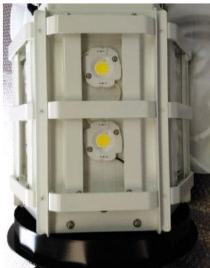
バルーン内部構造

メタルハライド700W(消費電力750W→360Wになる)より, 52%の省エネです。 寿命も5倍と長寿命。必要な時に即点灯できます。